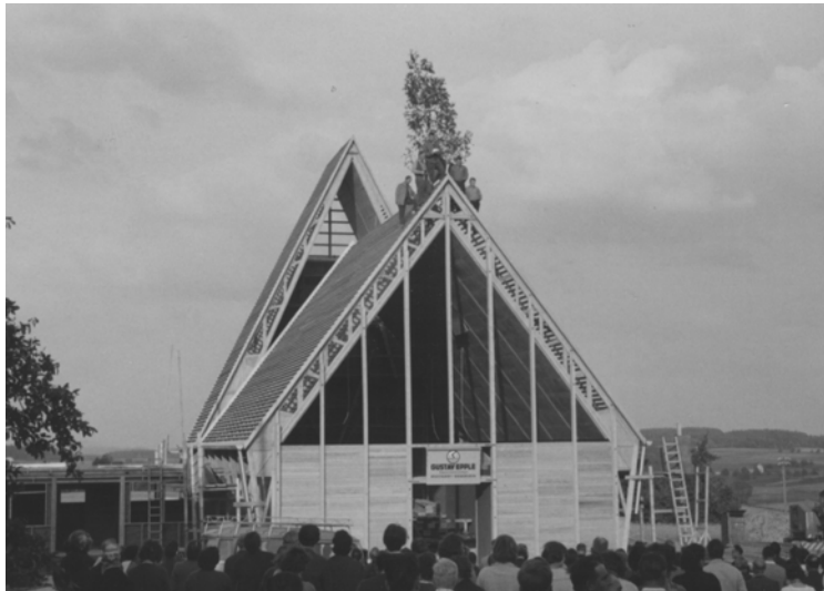
Richtfest bei der katholischen „Josefskirche“ 1963