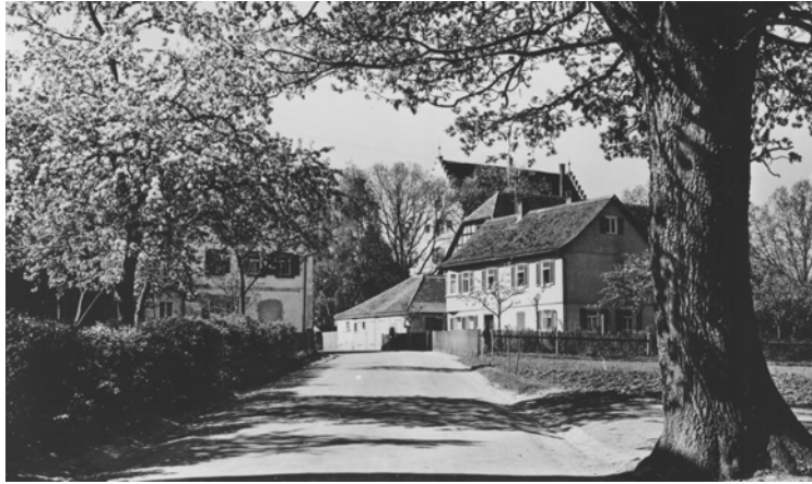
Schlossstraße damals in den 50er Jahren noch Wirtsgasse